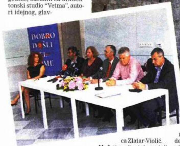
U nazočnosti ministrice kulture predstavljen je projekt obnove

Predstavljanju završetka obnove, u koju je uloženo gotovo tri milijuna eura, nazočila je ministrica kulture Andrea Zlatar-Viočić koja je izrazila nadu da će ovaj događaj biti ulaz u obnovu svih ladanjskih zdanja ovog zaštićenog područja