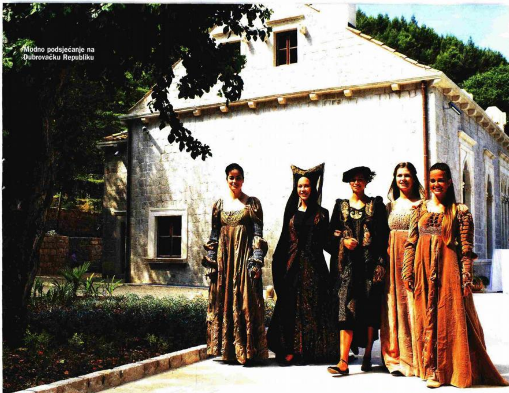
Modno podsjećanje na Dubrovačku Republiku

Napisala Lidija Crnčević