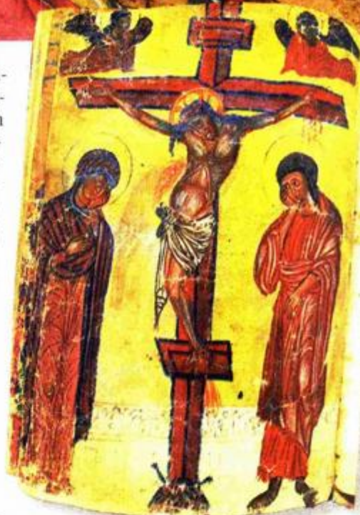
Raspeće, jedna od umjetnina iz matrikule maranguna

Prva minijatura u matrikuli prikazuje sv. Jurja kao konjanika. Danas je jednakih dimenzija kao i susjedni list, na kojem je prikaz sv. Vlaha i Bogorodice. Jedna od minijatura je prikaz Posljednje večere na kojoj. Isus sjedi na sredini polukružnog stola. Zatim je prikaz Golgote zdesna sa stojećim likom Bogorodice, a slijeva sv. Ivana Evangelista. Na minijaturi je prikazan osebujući tip raspela u obliku inicijala T na početku kanona („Te igitur“), iz srednjovjekovnih misala. Preko cijele stranice prikazan je i sveti jahač – ratnik na smeđe-crvenom konju, lik sv. Teodora s djelomično uništenim natpisom. Dubrovačka Crkva sv. Teodora se nalazila u seksteriju Pustijerna. Najra-