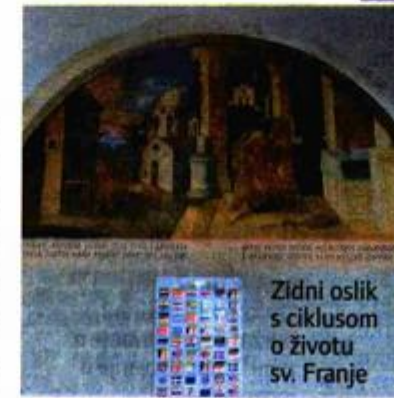
Zidni oslik s ciklusom o životu sv. Franje

konzervatorsko-restauratorske radove na osliku klaustra nastalom početkom 18. stoljeća koji na 18 luneta predstavlja ciklus iz života sv. Franje Asiškog. Različite obnove tijekom 19. i 20. stoljeća prekrile su originalni oslik, a tehnički slabo izvedene pretrpjele su znatna oštećenja, tako da je ono što je ikonografski prikaz života sv. Franje Asiškog postalo nečitljivo. Tijekom 2013./2014. završeni su radovi na istočnom krilu, čime je cjelokupni oslik dobio konačan oblik. Sanacijom osamnaeste lunete, otkriveno su nove scene. Ona predstavlja kraj ophoda, ujedno je na njoj završna scena iz života sv. Franje. Motiv smrti koji se pojavljuje na pret-