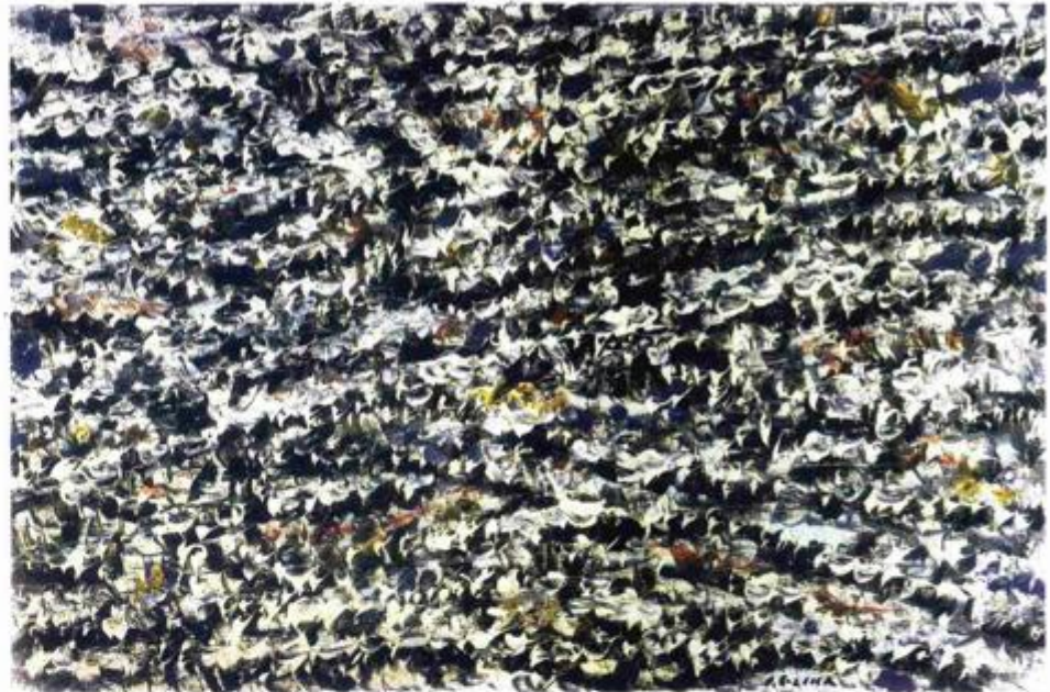
Gromače 1-80, ulje na platnu iz 1980. godine