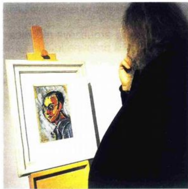
Autoportret iz 1953. godine – slika koja je i autoru bila važna. Gromače 4-86, ulje na platnu iz 1986. godine