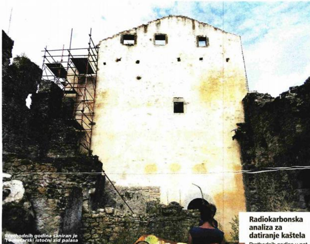
Prethodnih godina saniran je Tatarski istočni zid palasa