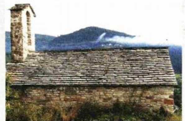
Crkvića uz sjeverni vanjski obrambeni bedem

Prvi sanirani objekt bila je ruševna crkvića sv. Marije Magdalene iz razdoblja između 11. i 13. stoljeća. Nalazi se uz sjeverni vanjski obrambeni bedem kaštela, a sanacija je trajala od 1999. do 2003. godine.