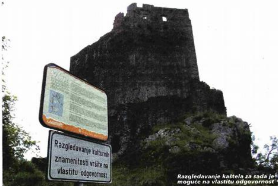
Razgledavanje kaštela za sada je moguće na vlastitu odgovornost