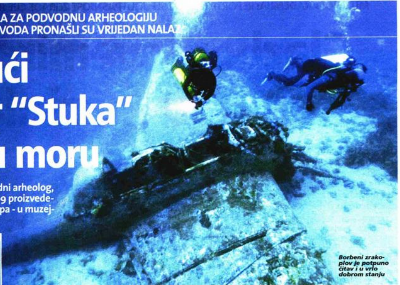
Borbeni zrakoplov je potpuno čitav i u vrlo dobrom stanju

Vrijednost tog nalaza, napominje podvodni arheolog, potvrđuje činjenica da su od ukupno 5.709 proizvedenih, sačuvana tek dva zrakoplova ovog tipa - u muzejskim postavama u Londonu i Chicagu