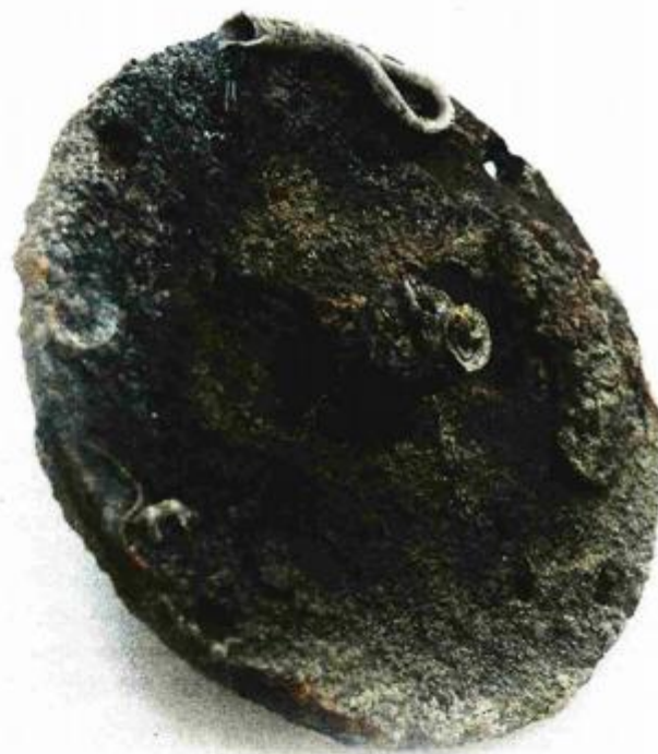
Dio manometra s kazaljkom