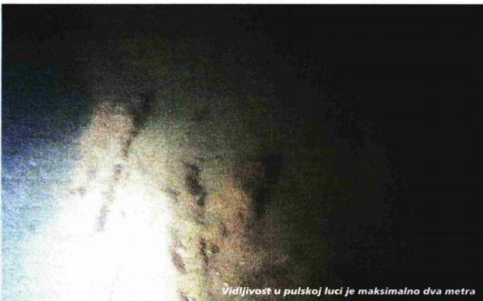
Vidljivost u pulskoj luci je maksimalno dva metra