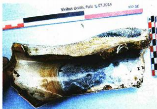
Pronađeno je mnogo komada raznovrsne keramike

la brončane dijelove s Viribus Unitisa i od njih je u ljevaonici Arsenala pulski skulptor Romeo Endrigo napravio Mussolinijevo poprsje koje je potom darovano u Rimu 18. travnja 1933. godine u ime 66 legije. Iz povijesti Viribus Unitisa, Zubčić izdvaja i 1944. godinu kada se u njemačkim zapisima spo-