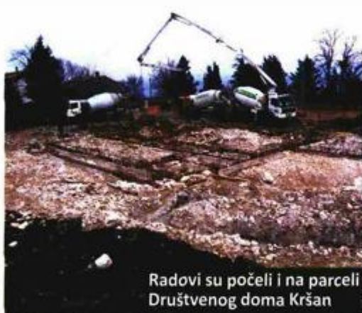
Radovi su počeli i na parceli Društvenog doma Kršan

Okončani su sanacija školske zgrade u Šušnjevići te sanacija svih vanjskih zidova kaštela Kršan i unutarnjih na razini prvog kata palasa, a mehanizacija i radnici su izašli na urušeni dio južnih zidina staroga grada Plomina i na parcelu Društvenog doma Kršan