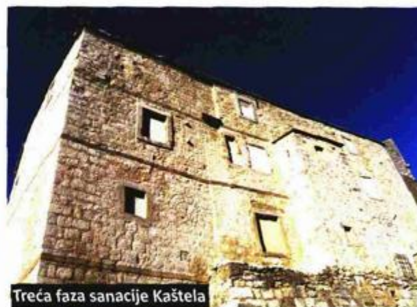
Treća faza sanacije Kaštela