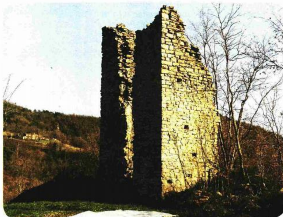
Kod kaštela Gradinje završavat će buduća pješačka staza kaštela