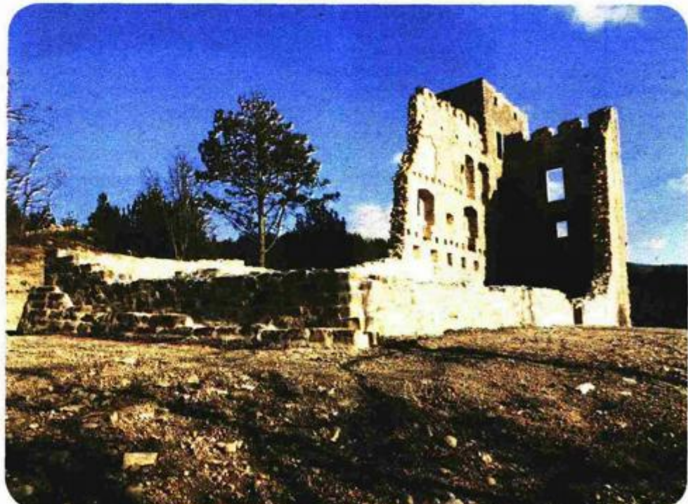
Kaštel Posrt zanimljiv je posjetiteljima jer je nedavno konzerviran kao ruševina