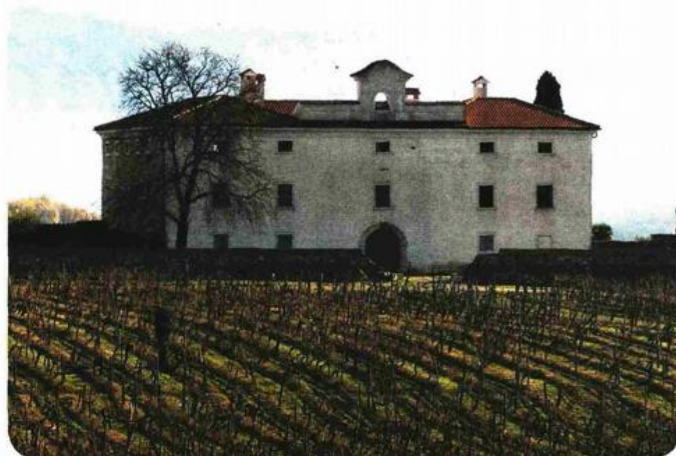
Kaštel Belaj u privatnom je vlasništvu

U vrijeme dok je grofovija bila u rukama Jurja Barba iz Kožljaka stari je belajski kaštel napušten, a u blizini je podignuta nova utvrda Posrt. Nova je tvrđava odigrala važnu ulogu u Uskočkom ratu kao utočište, baza, snaga austrijskih nadvojvoda koje su od 1615. do 1618.