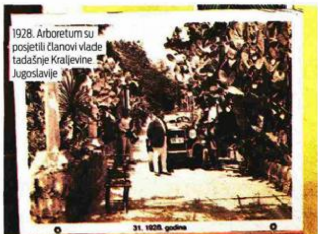
1928. Arboretum su posjetili članovi vlade tadašnje Kraljevine Jugoslavije