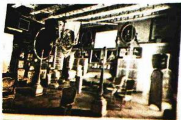
Ovako je početkom prošlog stoljeća izgledao salon obitelji Gučetić