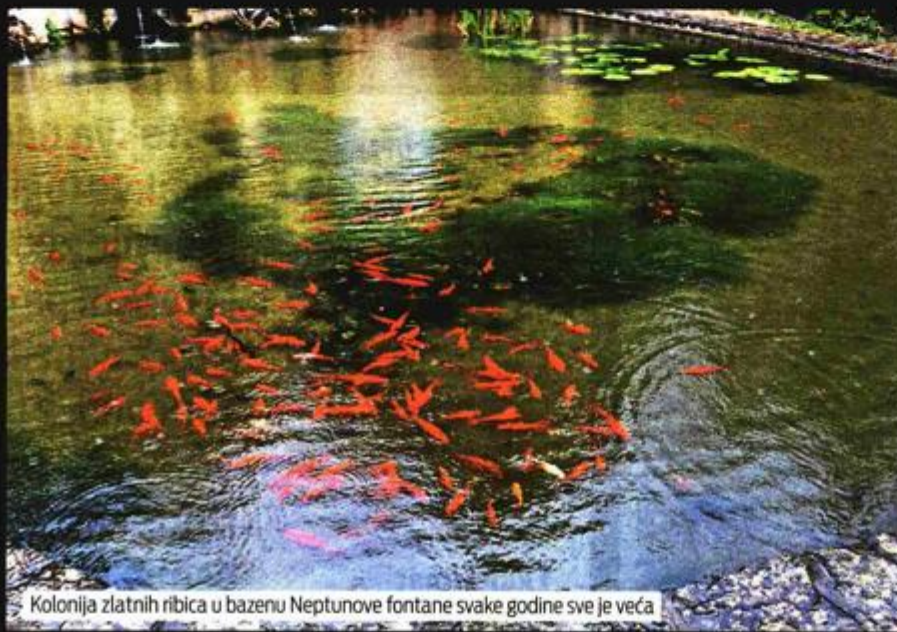
Kolonija zlatnih ribica u bazenu Neptunove fontane svake godine sve je veća

Obnova starinske mlinice novcem EU fondova rezultirat će otvaranjem muzeja maslinarstva, a svoje mjesto naći će i zbirka kartolina i literature koja prati povijest jedinog jadranskog arboretuma