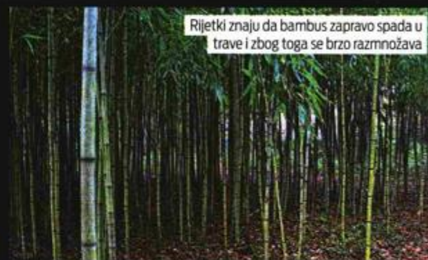
Rijetki znaju da bambus zapravo spada u trave i zbog toga se brzo razmnožava