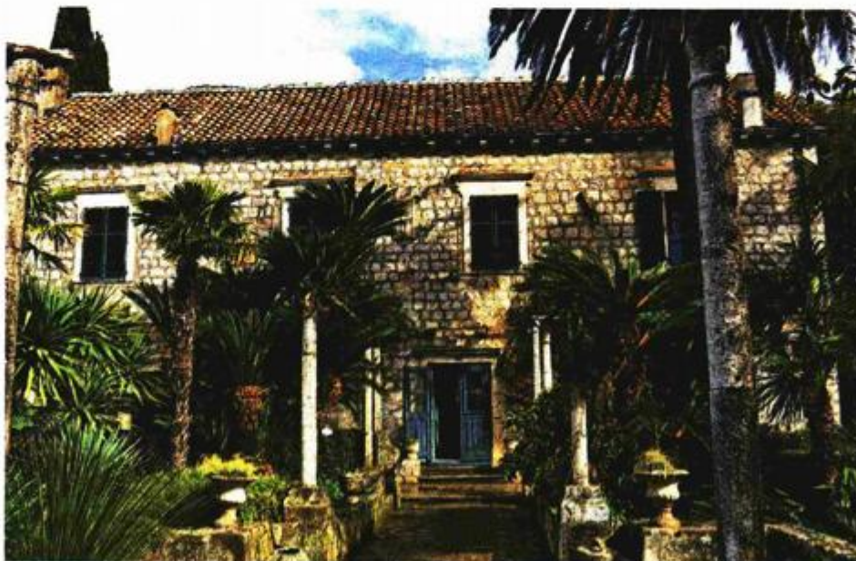
Sadašnja zgrada Gučetićeve ljetnikovca u Trstenu datira iz doba nakon katastrofalnog potresa 1667.

Prijelaz 19./20. st. - izgradnja novog (drugog) perivoja na zapadnom Posjedu zvanom Drvarica - neoromantičarski perivoj