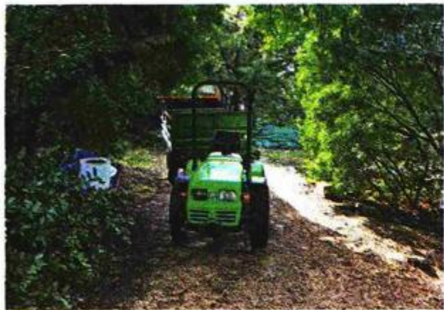
Traktori poput ovog glavno su prijevozno sredstvo i vozilo za opskrbu

ulaz već nekoliko godina besplatan, a gratis mogu koristiti i malonogometni teren kod maslinika, povremeno prizorište vjenčanja domaćih i furestih. Vjernicima je jednom godišnje za svetu misu raspoločiva obnovljena kapelica Svetog Jeronima iz 1540. Bogoslužje se održava na svečev blagdan 30.