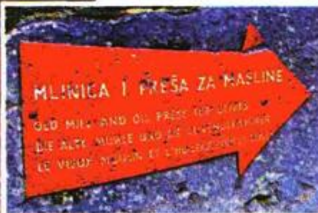
U okviru Arboretuma postoji mlinica koja će se obnavljati novcem EU fondova kao budući muzej maslinarstva