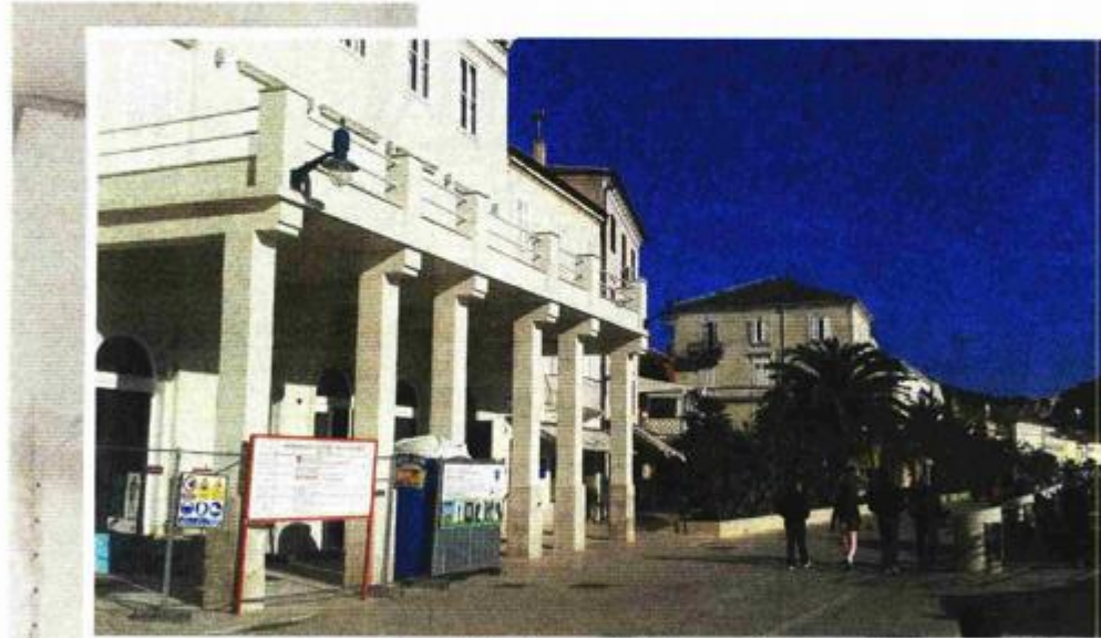
Palača Kvarner detaljno se priprema za "udomljavanje" svog najdragocjenijeg eksponata