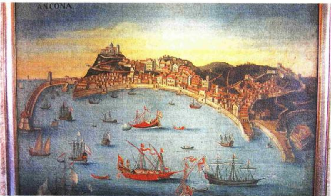
Nepoznati slikar: Veduta Ancone , 18. stoljeće ulje na platnu, Dubrovnik, Dubrovački muzeji – Pomorski muzej

ta, slika i crteža, u Galeriji Klovićevi dvori prepoznati vještinu brojnih slikara-specijalista koji su znali prikazati krajolike i vedute, predmete iz svakodnevice ili fiksirati tjelesna