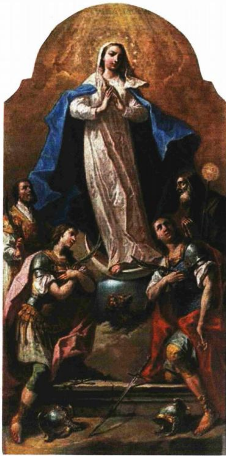
Gaspare Diziani: Bezgrešno začeće sa svecima , Završje, župna crkva Rodenja Blažene Djevice Marije