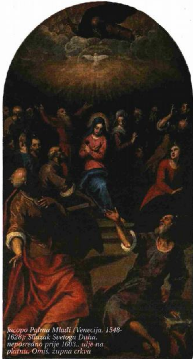
Jacopo Palma Mladi (Venecija, 1548-1628): Silazak Svetoga Duha, neposredno prije 1603., ulje na platnu, Omiš, župna crkva

Izložba u Klovićevim dvorima prvi put i cjelovito predstavlja najvrednije slike 17. i 18. stoljeća talijanskih majstora u Hrvatskoj, što je idealna prilika široj publici, ali i znanstvenicima i ljubiteljima umjetnosti da uživaju u vrijednim djelima ove epohe