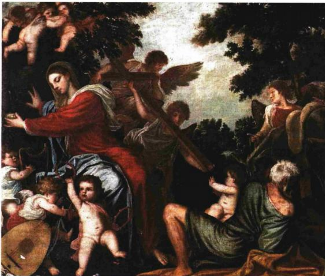
Alessandro Varotari Padovanino (Padova, 1588. – Venecija, 1649.), Odmor na putu u Egipat, drugo ili treće desetljeće 17. stoljeća , ulje na platnu, Dubrovnik, katedrala Gospe Velike