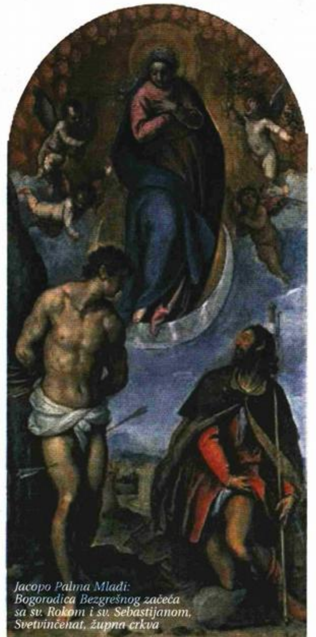
Jacopo Palma Mladi: Bogorodica Bezgrešnog začeća sa sv. Rokom i sv. Sebastijanom, Svetvinčenat, župna crkva

Izložba »Slikarstvo talijanskog baroka u Hrvatskoj« logično se nastavlja na izložbu »Tizian, Tintoretto, Veronese, veliki majstori renesanse« koja je s uspjehom postavljena krajem 2011. godine. Ona je predstavljala djela iz Hrvatske čiji su autori ugledni renesansni slikari iz različitih talijanskih umjetničkih središta, od Venecije preko Bologne do Firenze – uvodi nas u pozadinu nastanka aktualne izložbe u Galeriji Klovićevi dvori »Slikarstvo talijanskog baroka u Hrvatskoj« – akademik Radoslav Tomić, autor postava izložbe i uvodnog teksta kataloga izložbe.