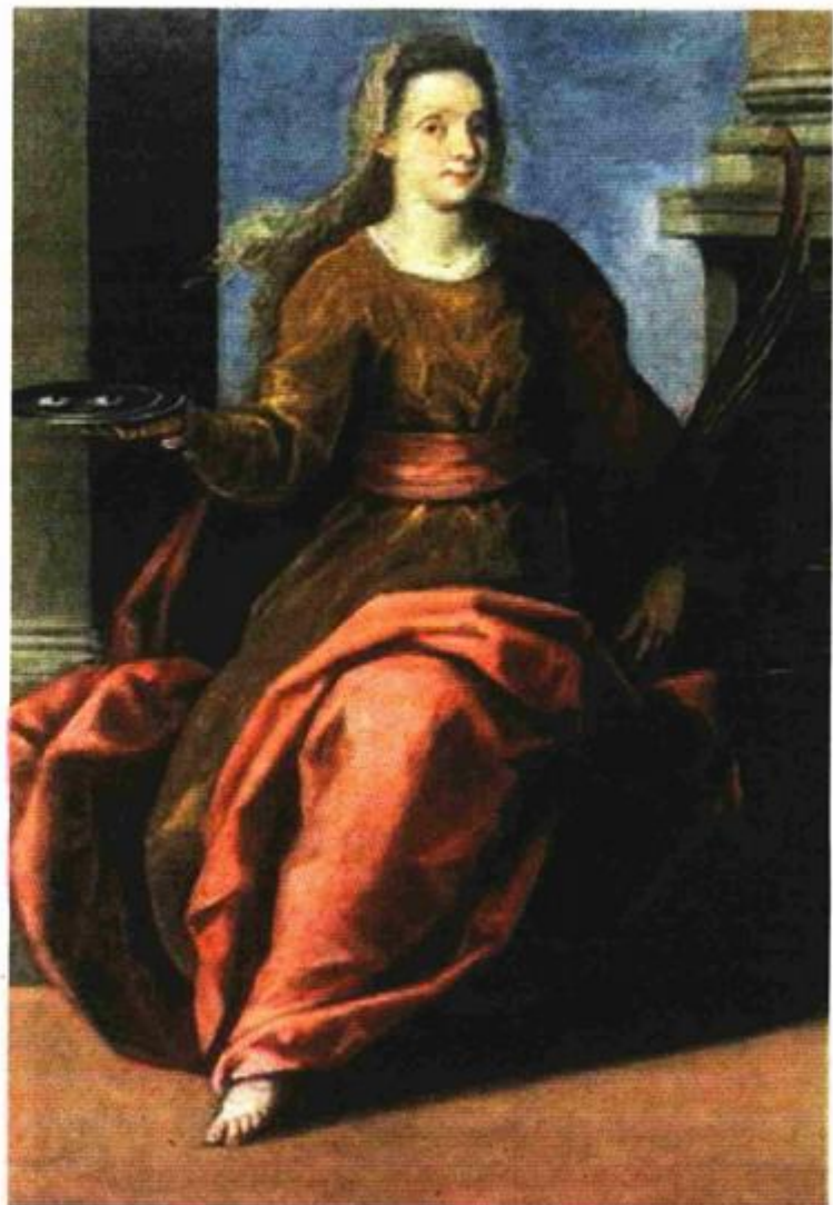
Jacopo Palma Mladi: Sv. Lucija , Rijeka, Povijesni i pomorski muzej Hrvatskog primorja