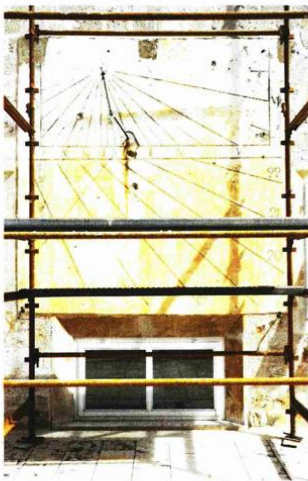
Sat na zidu sjevernog krila

— Kao i većina sunčanih satova i ovaj je izveden zgrafito tehnikom, odnosno postupkom urezivanja u žbuku. Donja ili prva žbuka je tamnija krupnije granulacije i ona se vidi u svim djelovima gdje su brojevi i linije koje pokazuju podjelu vremena. Završni sloj je savršeno glatka površina koja se dobije smjesom vapna mramornog brašna