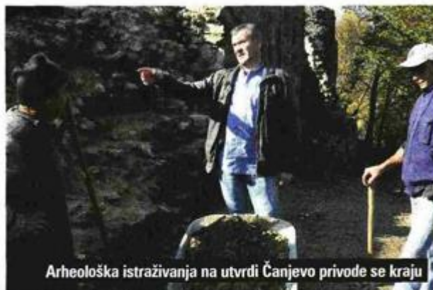
Arheološka istraživanja na utvrđi Čanjevo privode se kraju

– Do sada su poznate tri faze gradnje utvrde, od 15. stoljeća, 16. i 18. stoljeća. Utvrda se prvi put spominje u 15. stoljeću, a njen posljednji vlasnik bila je obitelj Praškoci. Pronađeni su arheološki materijali koji nam govore o naseljavanju ovog lokaliteta u prapovijesti te nakon duže pauze ponovo u 15. stoljeću, kada nastaje sama utvrda. Arheološka istraživanja privode se kraju, definiran je tlocrtni oblik same utvrde, a još samo pre-