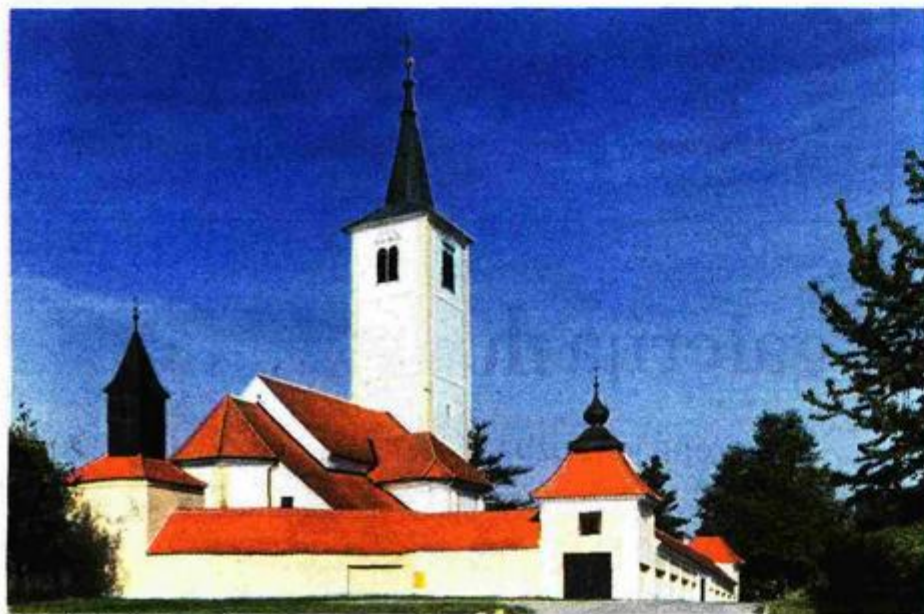
Crkva Marije Snježne u Belcu

Četiri medaljona na svodu prikazuju Navještenje, Pohod Bogorodice Elizabete, Rađanje Krista i Poklonstvo Sveta Tri