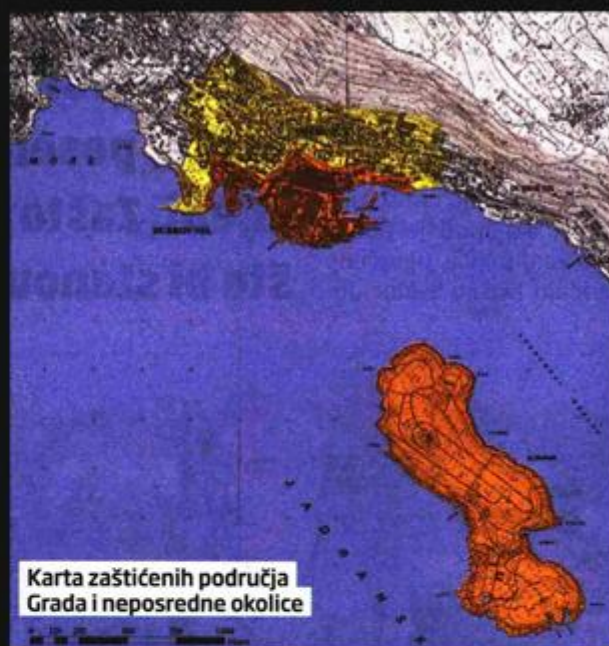
Karta zaštićenih područja Grada i neposredne okolice

nika na listu ugrožene svjetske baštine – pribojava se Selmani. Za njega je od svega najstrašnije što se nitko iz Grada Dubrovnika nije pojavio u