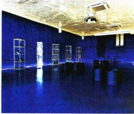
Plava soba (gore) i ulaz u muzej (dolje) koji je smješten unutar palače Kvarner, na samoj obali, neposredno uz more