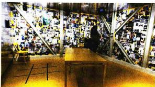
U ovoj su sobi mnogi tekstovi koji su do sada izašli o brončanom kipu

Sedamnaest godina od otkrića 'Atleta' je dobio i svoj 'dom' koji se sutra otvara