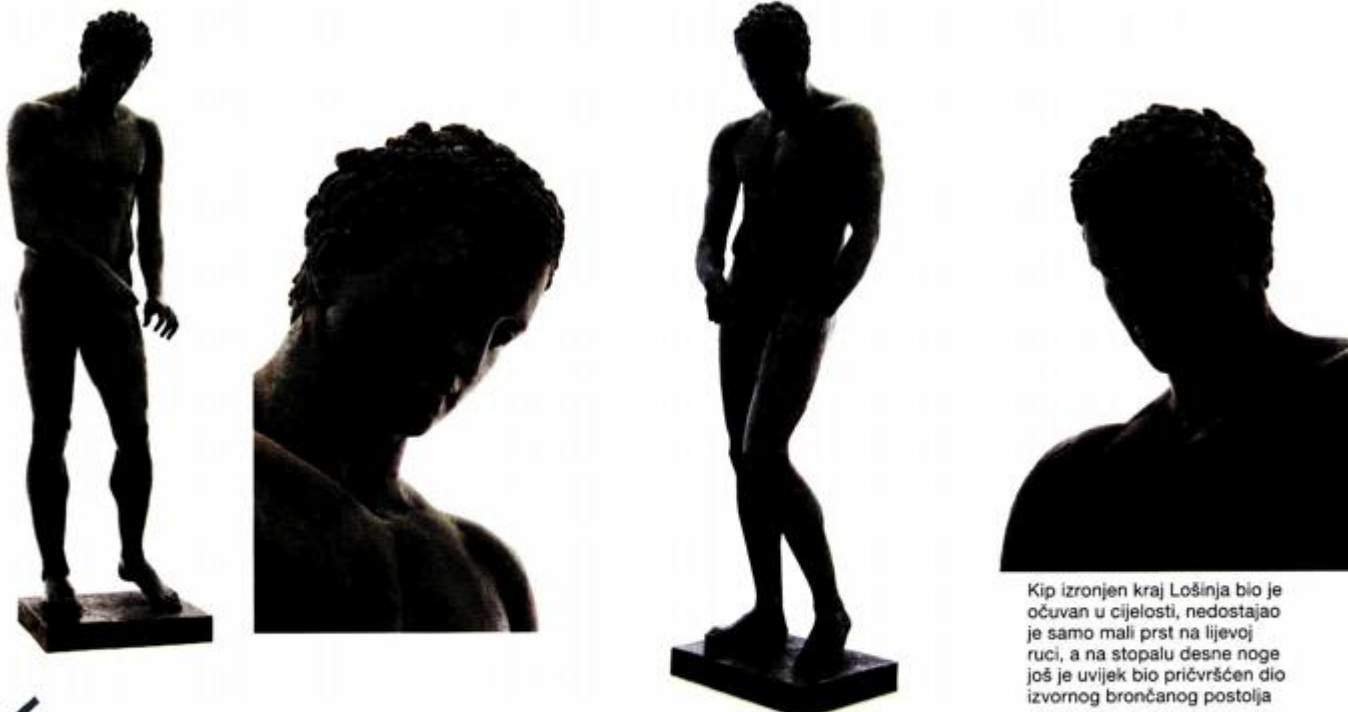
Kip izronjen kraj Lošinja bio je očuvan u cijelosti, nedostajao je samo mali prst na lijevoj ruci, a na stopalu desne noge još je uvijek bio pričvršćen dio izvornog brončanog postolja