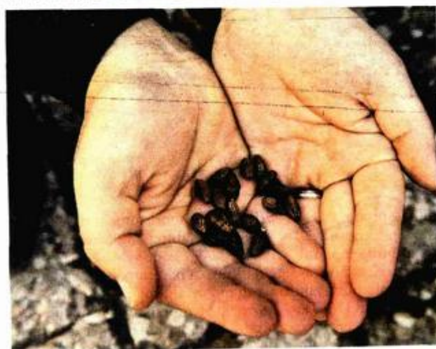
Podvodni arheolog Jurica Brezak (gore) i njegov tim otkrili su amfore grčko-italskog tipa koje su krile velik broj nevjerojatno sačuvanih koštica maslina (lijevo)