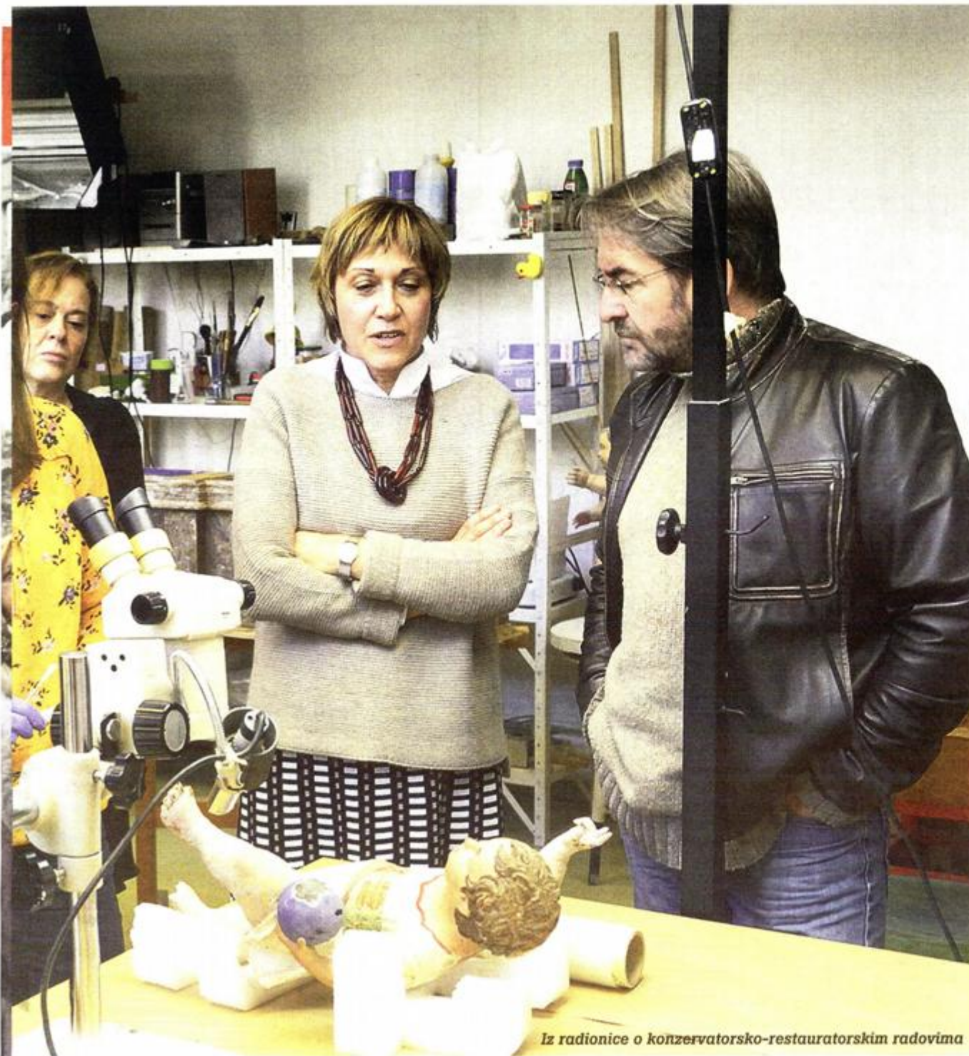
Iz radionice o konzervatorsko-restauratorskim radovima