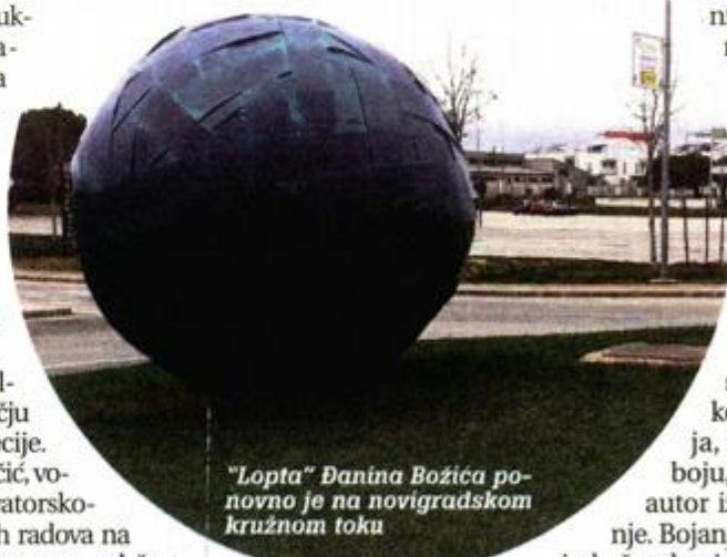
"Lopta" Đanina Božića ponovno je na novigradskom kružnom toku

ostvaruje iznimnu suradnju s Hrvatskim restauratorskim zavodom, ističe i da je za ovog posjeta, istarsko izaslanstvo upoznato i s tijekom rekonstrukcije ciklusa slika Bruna Mascarellija, barda likovne umjetnosti iz Rovinja.