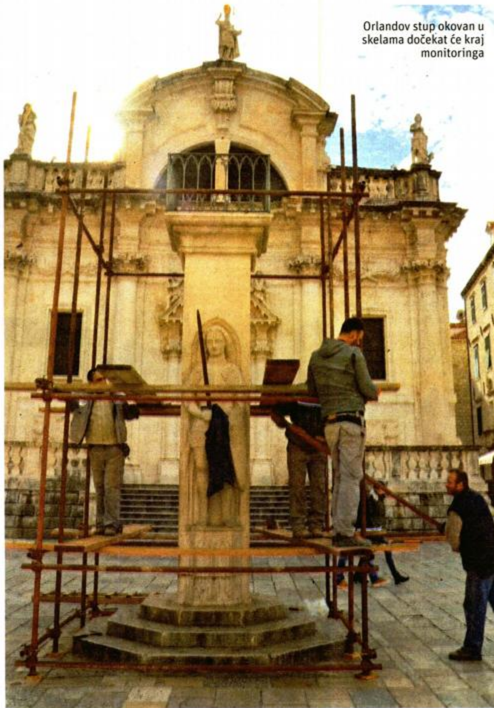
Orlandov stup okovan u skelama dočekat će kraj monitoringa

koji će voditi projekt sanacije oštećenja.