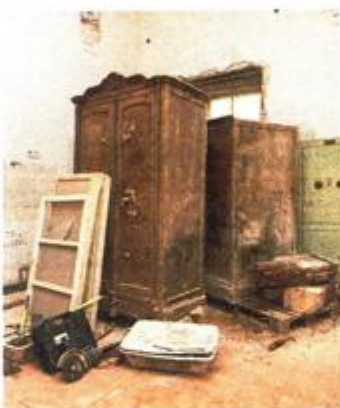
Unutrašnjost bivše upravne zgrade skrivala je stari namještaj i artefakte (fotografija gore)

VAŽNA KARIKA Kako je istaknuo riječki gradonačelnik Vojko Obersnel, riječ je o jednoj od najljepših palača u Hrvatskoj s kraja 18. stoljeća, bivšoj upravnoj zgradi Tvornice šećera, koja je važna karika u industrijskoj povijesti Rijeke. Vrijednost ugovorenih radova, koje izvodi slovenska tvrtka VG5 d.o.o., iznosi 44,5 milijuna kuna, a stručni nadzor na rekonstrukciji, vrijedan milijun kuna, obavlja Institut IGH