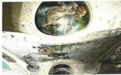
Obnova Palače Šećerane vrijedna je 44,5 milijuna kuna, a njome će upravljati Muzej grada Rijeke