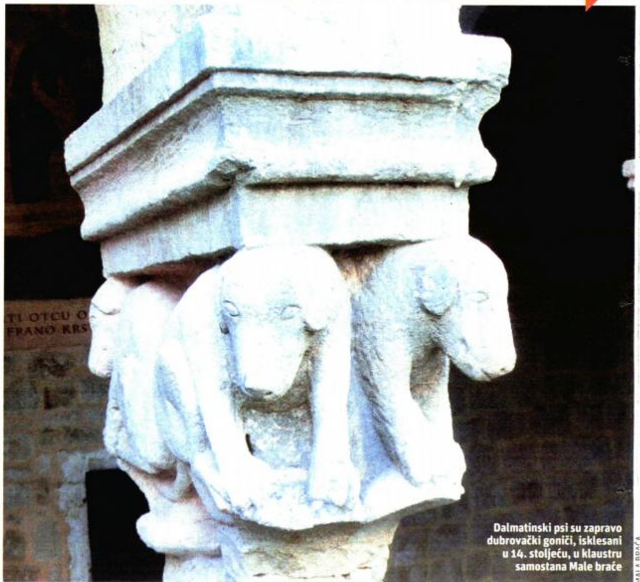
Dalmatinski psi su zapravo dubrovački goniči, isklesani u 14. stoljeću, u klastru samostana Male braće

► O abortusu: Ne može postojati pravo raspolaganja tuđim životom. Te se teme iskorištavaju politički, pred izbore, što je pogrešan pristup. A zabrana? Neke su zemlje imale zabrane, pa time nisu riješile to pitanje