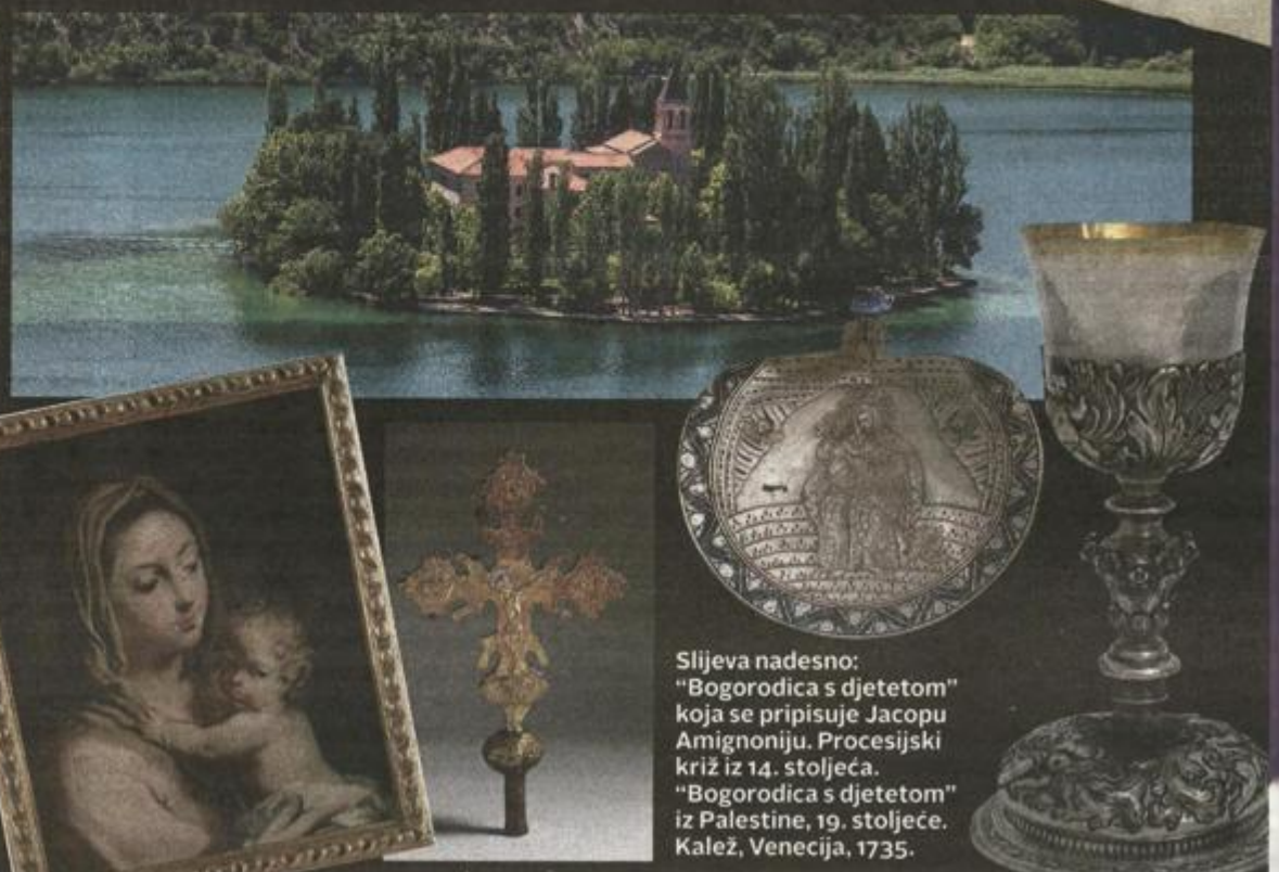
Slijeva nadesno: "Bogorodica s djetetom" koja se pripisuje Jacopu Amignoniju. Procesijski križ iz 14. stoljeća. "Bogorodica s djetetom" iz Palestine, 19. stoljeće. Kalež, Venecija, 1735.