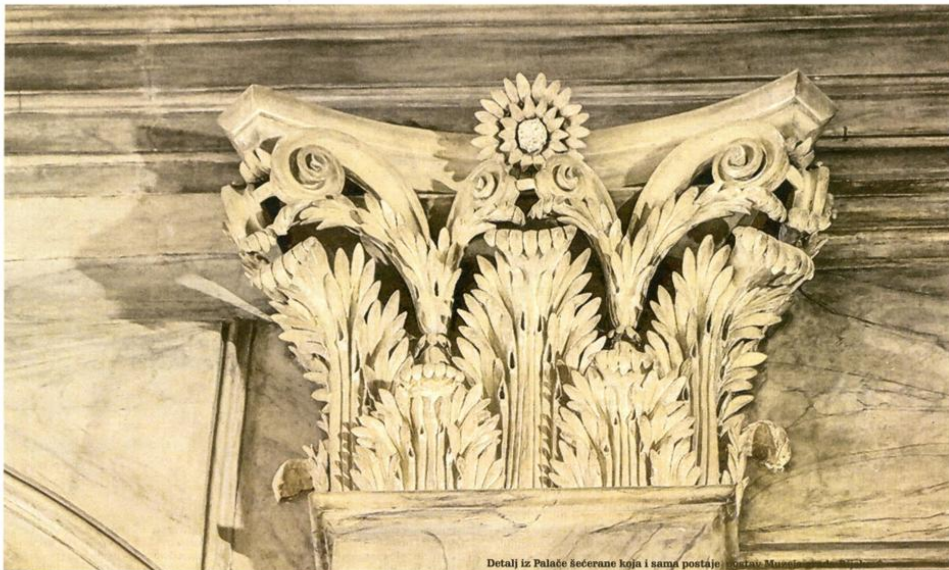
Detalj iz Palače šećerane koja i sama postaje muzej grada Rijeke

usmjeravati djecu u stvaralačkim procesima. Dječja kuća bit će mostovima povezana s prostorima MMSU što će u cijelosti unijeti novu dinamiku u aktivnosti muzeja.