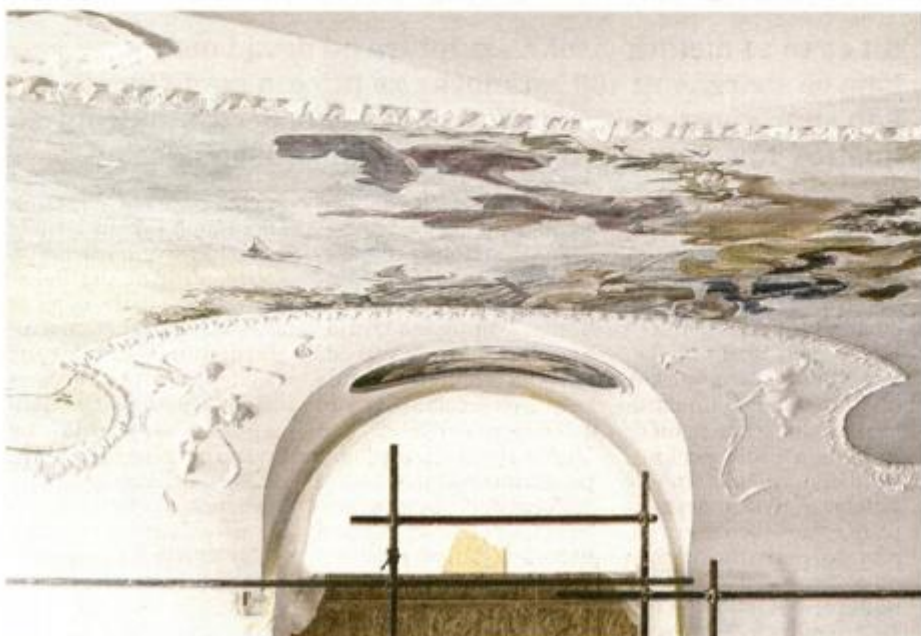
Zidove Palače šećerane krasi iznimno vrijedne freske u kojima će moći uživati posjetitelji Muzeja grada Rijeke