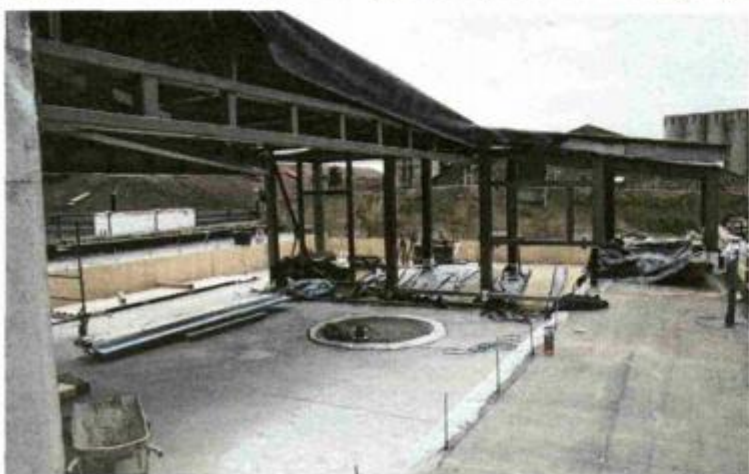
Na krovu Dječje kuće dovršava se mali amfiteatar u kojem će se održavati interaktivne predstave

djece 21. stoljeća rođene u dinamičnom, promjenjivom svijetu digitalnih tehnologija. Na trećem katu Dječje kuće smjestit će se Stribor, odjel gradske knjižnice za djecu, a na samom krovu, u prostoru malog krovnog amfiteatra, dogadati će se pripovjedno kazalište. Sve programe, radionice i aktivnosti u koje će se djeca moći uključiti, osmišljavaju i provodit će zajednički tri gradske kulturne ustanove - Art kino, Gradska knjižnica i Gradsko kazalište lutaka - uz svoje vanjske partnere, udruge i nezavisne organizacije, te mentore koji posjeduju posebna znanja i vještine u pojedinim područjima i koji će voditi i