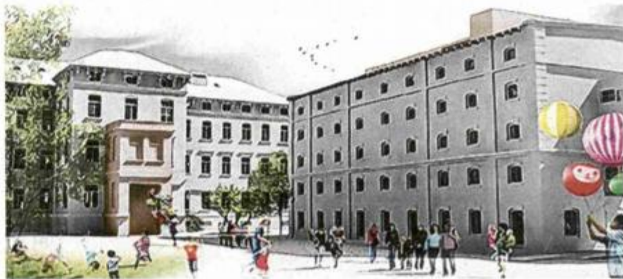
Vizualizacija - Gradska knjižnica i Dječja kuća