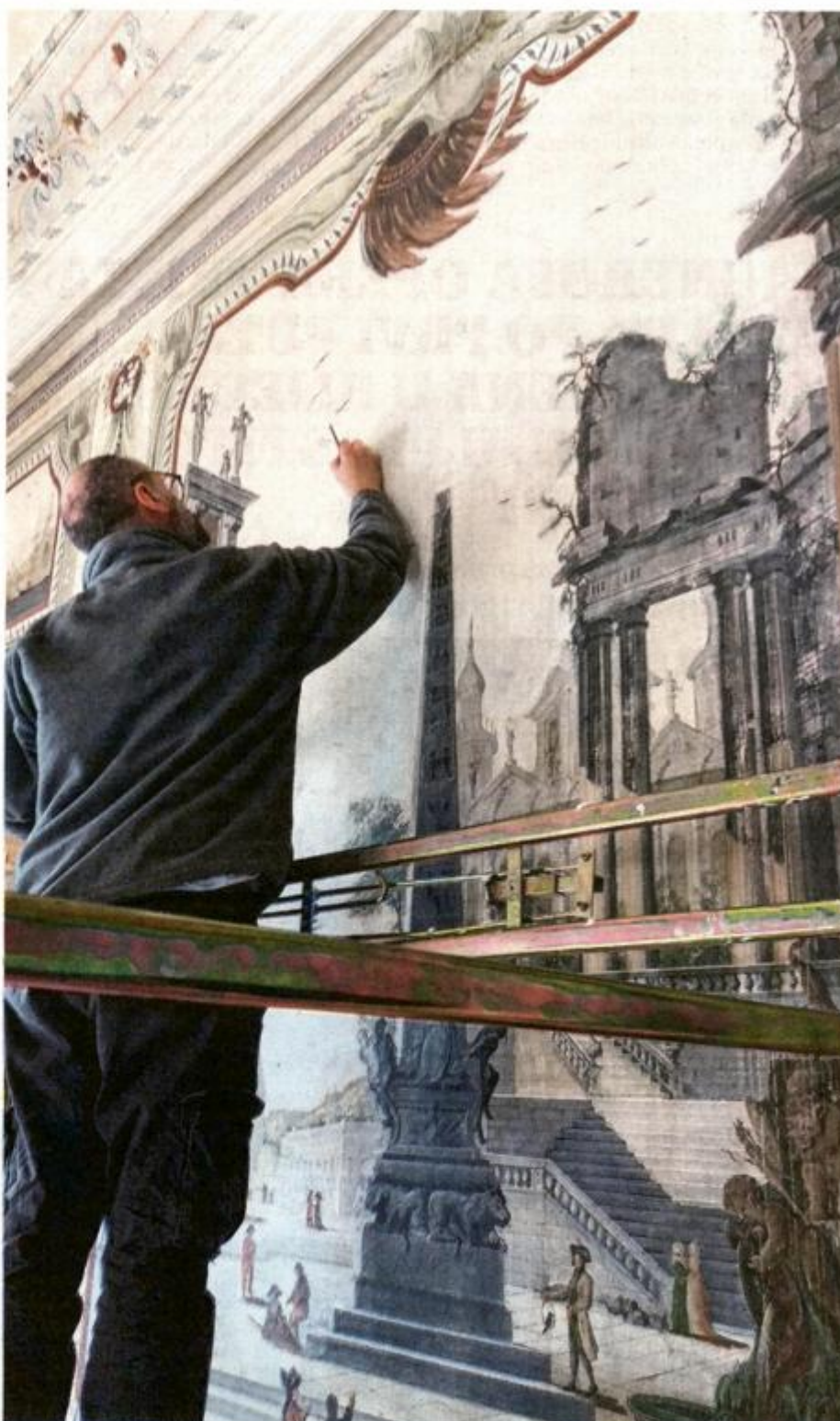
Oslikani zidovi palače pažljivo se obnavljaju

Palača šećera sagrađena je kao upravna zgrada Tvornice šećera 1752. godine i označila je početak industrijskog razvoja Rijeke. Nakon požara 1785. značajno je obnovljena i opremljena baroknim interijerima sa zidnim slikama i štukaturom te danas predstavlja najkvalitetniju baroknu palaču na istočnoj jadranskoj obali. Godine 1851. u zgradi je smještena uprava Tvornice duhana, a nakon 1945. godine ponovno mijenja namjenu i postaje sjedištem Tvornice motora i traktora »Rikard Benčić«.