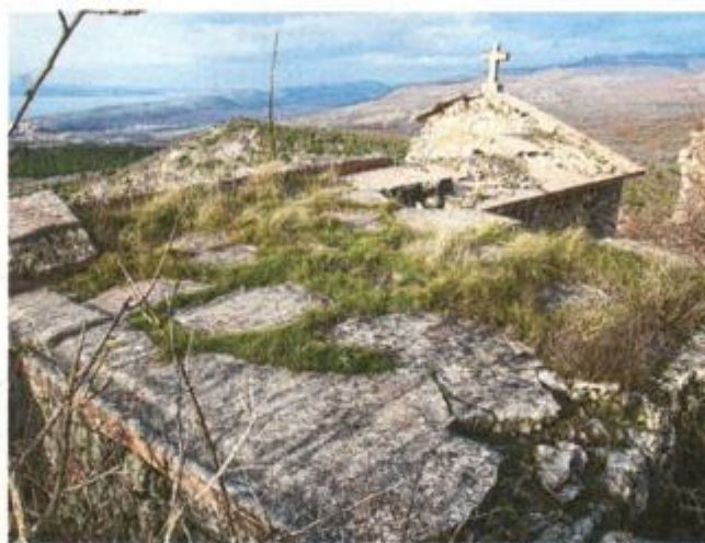
Crkva sv. Stjepana