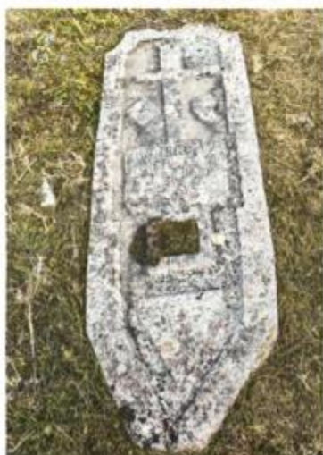
Nadgrobna ploča s kraja 19. stoljeća