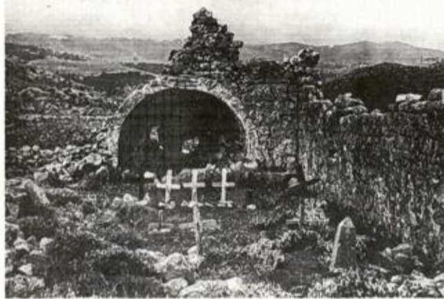
Dokumentacija Konzervatorskog odjela u Rijeci