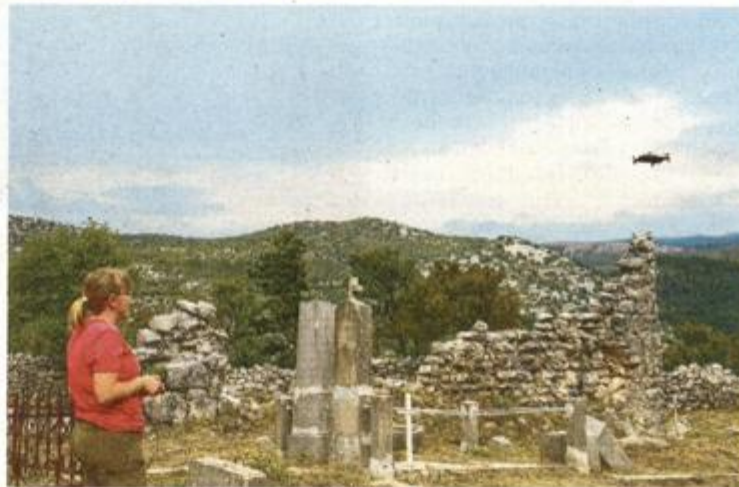
U istraživanjima se koristi moderna tehnologija

Zahvaljujući snimkama drona članica istraživačkoga tima Valerija Gligora izradila je cjelovitu zračnu snimku lokaliteta, koja je bitna jer se trenutno zbog vegetacije i nepristupačnog terena ne može doći do svih struktura staroga grada. Zračna