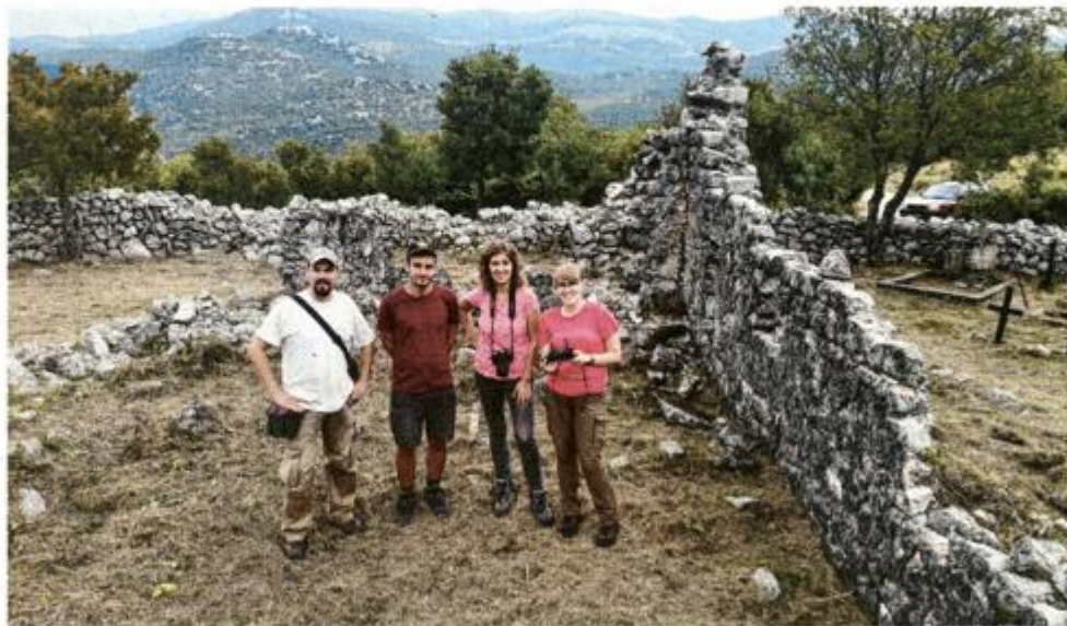
Tim na zadatku

Pri istraživanju područja oko crkve sv. Jurja naišli su i na nadgrobnne ploče s kraja 19. stoljeća te groblje iz 20. stoljeća koje se djelomično koristi i danas. Nadgrobnne ploče imaju vrlo specifičnu formu i ikonografiju: pretežno su duguljastog pravokutnog oblika sa zašiljenim donjim dijelom. No ne stoje, kao što bi se očekivalo, okomito ukopane u zemlju, nego pokrivaju grobne rake u cijelosti. U sredini imaju udubinu koja je vjerojatno služila da bi se postavio križ ili cvijeće, a ukrašene su specifično izvedenim motivima lovorovog ili maslinovog lišća, križa i srca sa zrakama, kakvih nema na drugim lokalitetima. Natpisi, na latinici i hrvatskome jeziku, donose imena i prezimena pokojnika, godinu rođenja i smrti, a pretežno se radi o mlađim osobama. Ne zna se je li možda riječ o žrtvama neke