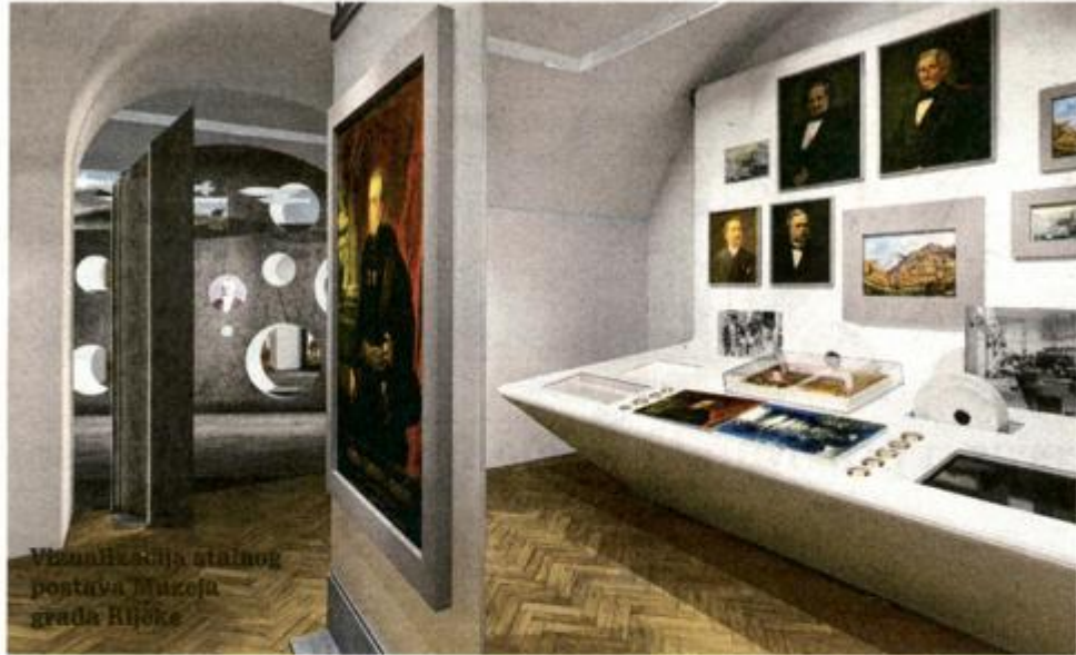
Vizualizacija stalnog postava Muzeja grada Rijeka

kulturu utvrdimo novi datum otvorenja, te da uskladimo rokove s posuditeljima. Zasad pomišljamo da bi to moglo biti u svibnju ili lipnju 2021. godine, uoči nove turističke sezone – otkriva nam Dubrović.