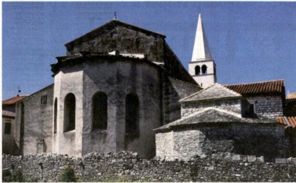
Blizina Eufrazije bazilike dodatna je prednost kompleksu