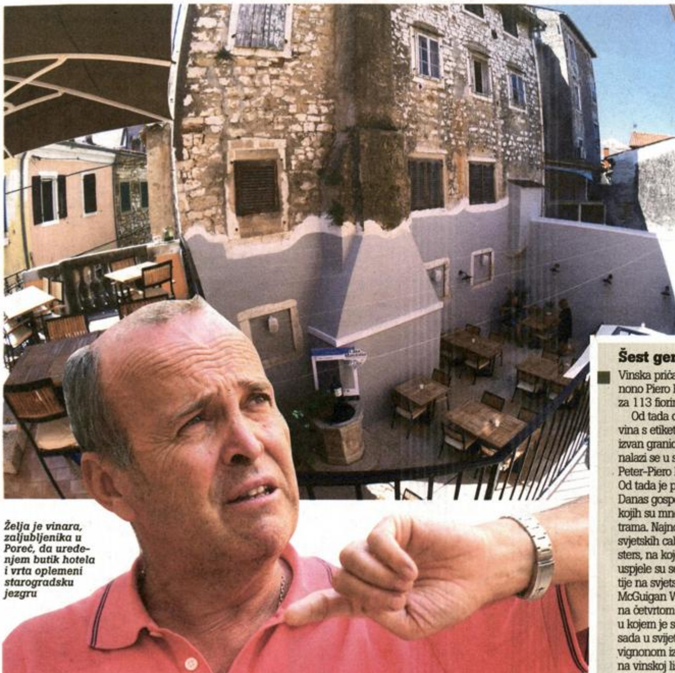
Želja je vinara, zaljubljenika u Poreč, da uređenjem butik hotela i vrta oplemeni starogradsku jezgru