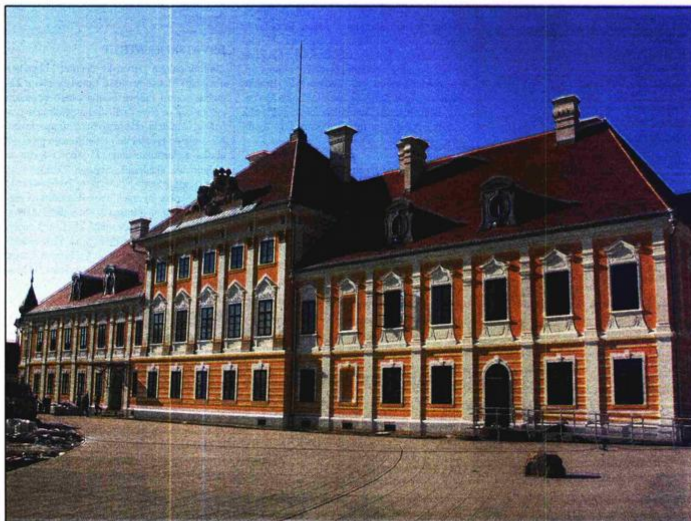
Obnovljeni dvorac Eltz, 2011.; Hrvoje Cvitančić