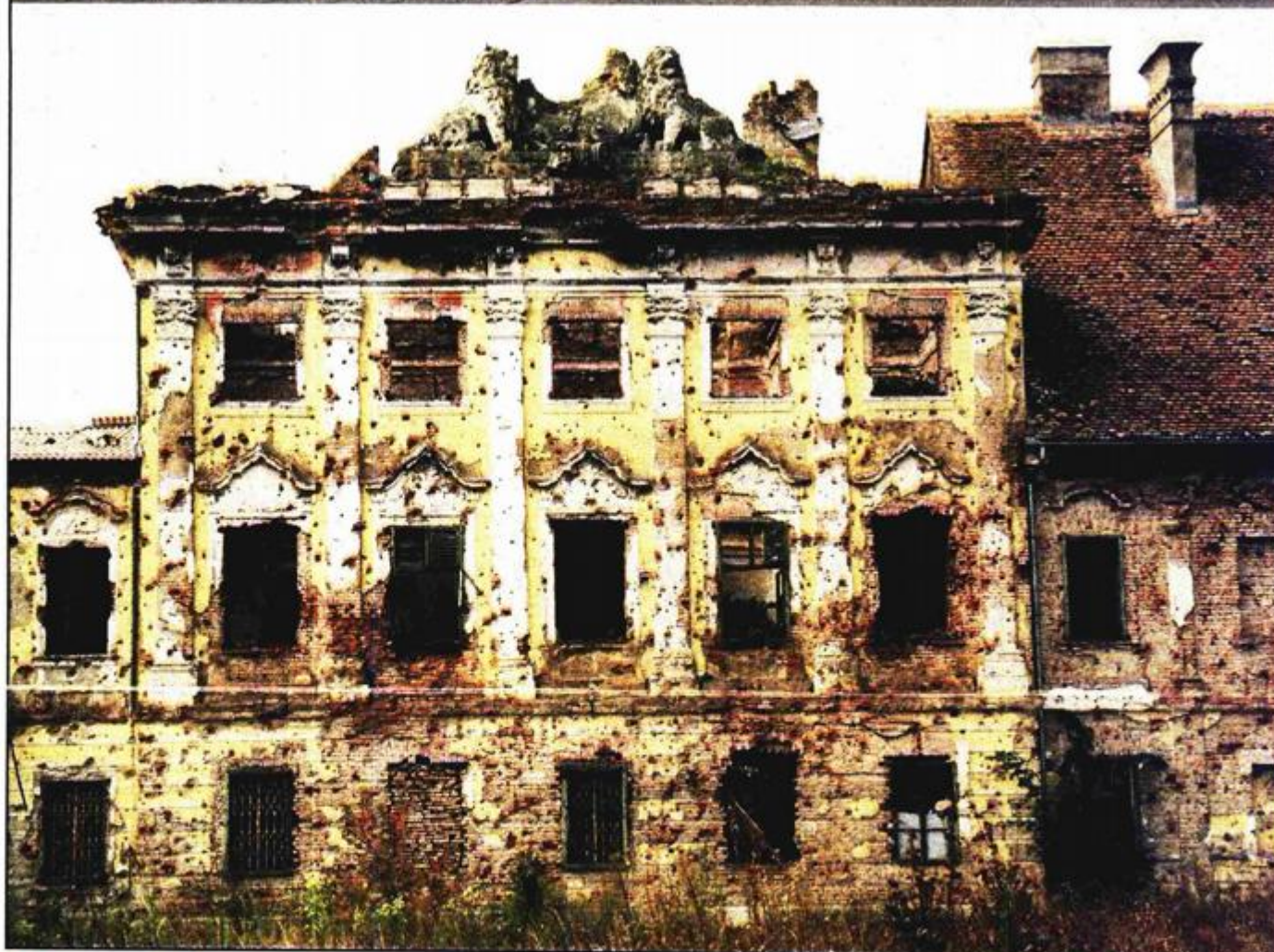
Dvorac Eltz, stanje 1991.