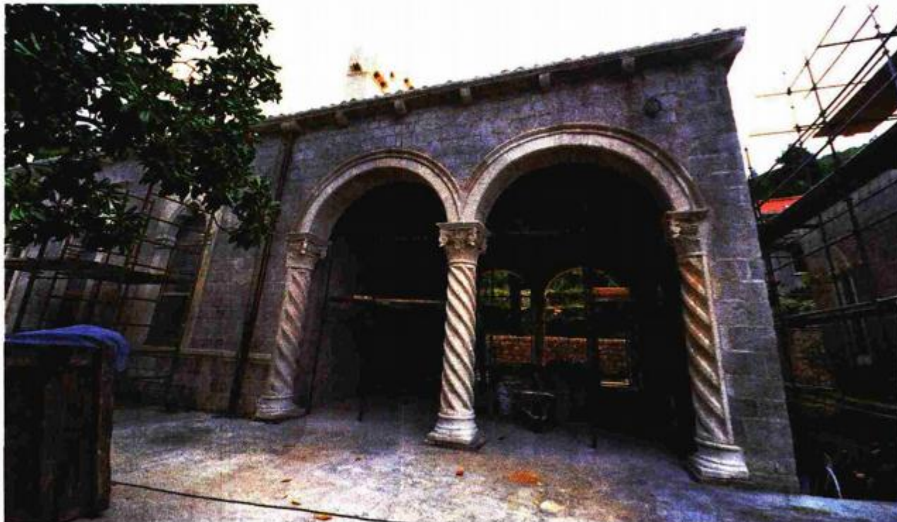
Obnovljenoj lođi ljetnikovca vraćena je izvorna ljepota

Ombles na obali mora». Ljetnikovac koji danas zatičemo dao je podignuti Miho Junijev Bunić koji umire 1530.; u ime njegovog, tada još maloljetnog sina Junija naručena je 1538. gradnja kapelice; posjed na Batahovini spominje se i u Junijevoj oporuci iz 1610.; Junijev unuk Augustin po-