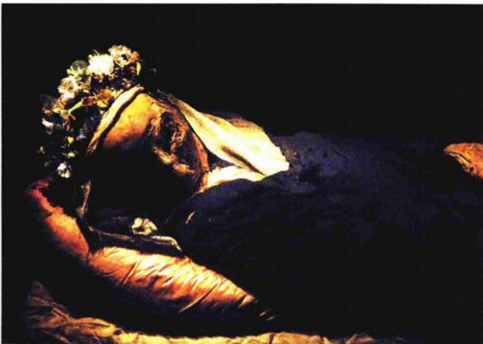
Čudesne moći i tijelo časne sestre Nikoloze Burse

- Od studenoga 2009. pa do veljače 2012. antropološkim analizama, s čak 12 tisuća snimaka i CT projekcijama nastojali smo utvrditi minimalan broj osoba kojima pripadaju kosti iz sarkofaga, za što je dobro poslužilo iskustvo iz Domovinskog rata, te je tako utvrđeno da se one odnose na devet muških, tri ženske osobe i sedmero djece, a u zapisima i životopisima stoji da kosti pripadaju 31 svecu. Ono što se donekle sa sigurnošću može tvrditi i što se podudara sa zapisima su kosti triju žena - sv. Lidija, sv. Krispina i sv.