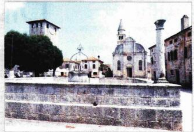
Najcjelovitiji primjer renesansnog stila u istarskom graditeljstvu - Svetvinčenat

Dr. Ivan Matejić u Istarskoj enciklopediji daje jedan cjelovit pregled renesanse u Istri, stilskog razdoblja europske umjetnosti XV. i XVI. st., što se odlikuje obilnim korištenjem predložaka antičke umjetnosti, poglavito u graditeljstvu i kiparstvu. Izdvajamo neke karakteristike; u arhitekturi se to očituje u dijelovima fortifikacija što se obnavljaju ili nanovo grade (Poreč, Pula, Roč, Oprtalj), katkad raskošnija bifora (Labin, Buje), a naslikani renesansni motivi na pročelima kuća sačuvani su u Kopru i Bujama. Najcjelovitiji primjer renesansnog stila u istarskom graditeljstvu pokazuje središte u Svetvinčentu u kojem tadašnji vlasnici, mletačka obitelj Morosini, gradi pravi renesansni trg s kaštelom, župnom crkvom trolisnog pročelja, gradskom lođom i nizom jednokatnica s renesansnim monoforama.