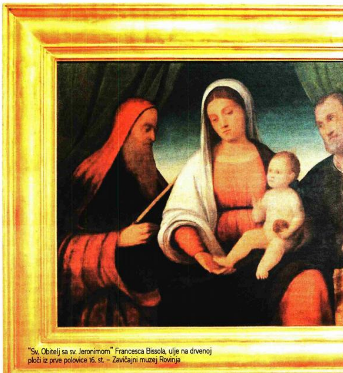
"Sv. Obitelj sa sv. Jeronimom" Francesca Bissola, ulje na drvenoj ploči iz prve polovice 16. st. - Zavičajni muzej Rovinja

- Djela Tiziana, Tintoretta, Veronesea, Carpaccia, Bellinija, Lotta, Crive-