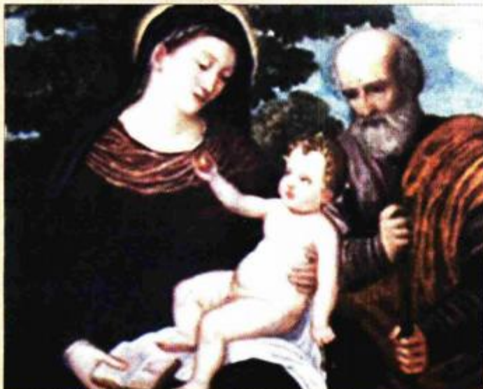
"Sv. Obitelj", uljana boja na drvu mletačkog slikara iz sredine 16. st.

Od kustosa Zavičajnog muzeja grada Rovinja Darija Sošića saznajemo da ova ustanova posjeduje desetak umjetnina iz razdoblja 16. stoljeća. Pored izložene slike Francesca Bissola u Klovičevim dvorima, još sedam slika, jedna grafika i jedna polikromirana skulptura čine lijepu renesansnu cjelinu. Umjetnine su pripadale zbirci austrijskog grofa Hutterott s otoka sv. Andrija (crveni otok) a nabavljane su na tržištu umjetnina u Veneciji i Trstu sredinom 19. stoljeća. To su: Portret plemića , Georgiusa Palme, ulje na bakarnoj ploči s kraja 16. stoljeća; Sv. Katarina , ulje na tkanini mletačkog slikara iz druge polovice 16. st.; Bogorodica s djetetom, malim Ivanom Krstiteljem i anđelima , pripisuje se Leandru Bassanu koji je živio od 1557. do 1620. djelovao je u Veneciji; Poklonstvo kraljeva , uljana boja na drvu, pripisuje se Bonifaciu de'Pitati iz prve polovice 16. st.; Sv. Obitelj , uljana boja na drvu mletačkog slikara iz sredine 16. st.; Zaruke sv. Katarine , uljana boja na drvu mletačkog slikara iz sredine 16. st.; Sv. obitelj sa sv. Jeronimom , Francesca Bissola, ulje na drvenoj ploči iz prve polovice 16. st.; Bitka kod Lepanta 1571. , bakropis Bonifacia Natalea (Nadal) iz 1572.; Bogorodica s djetetom , pripisuje se krugu sljedbenika Calista Piazza, slikara iz Lodijske škole čija je aktivnost zabilježena između 1524. i 1562. godine; Bogorodica s djetetom , polikromirana skulptura nepoznata majstora