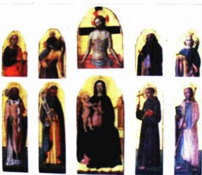
Poliptih Antonija Vivarinija, Venecija, 1440., koji se čuva u Poreču

- Na Tizianovoj slici iz dubrovačke katedrale, naručitelj - vjerojatno netko iz plemićke obitelji Pucić - naslikan je uz svetog Dominika, Mariju Magdalenu i svetoga Vlaha. Remekdjela koja nam stižu s Hvara bila su u posjedu obitelji Lucić i Hektorović, istaknuo je Tomić te dodao da je neke od ovih slika zagrebačka je publika već vidjela kad je prije ne-