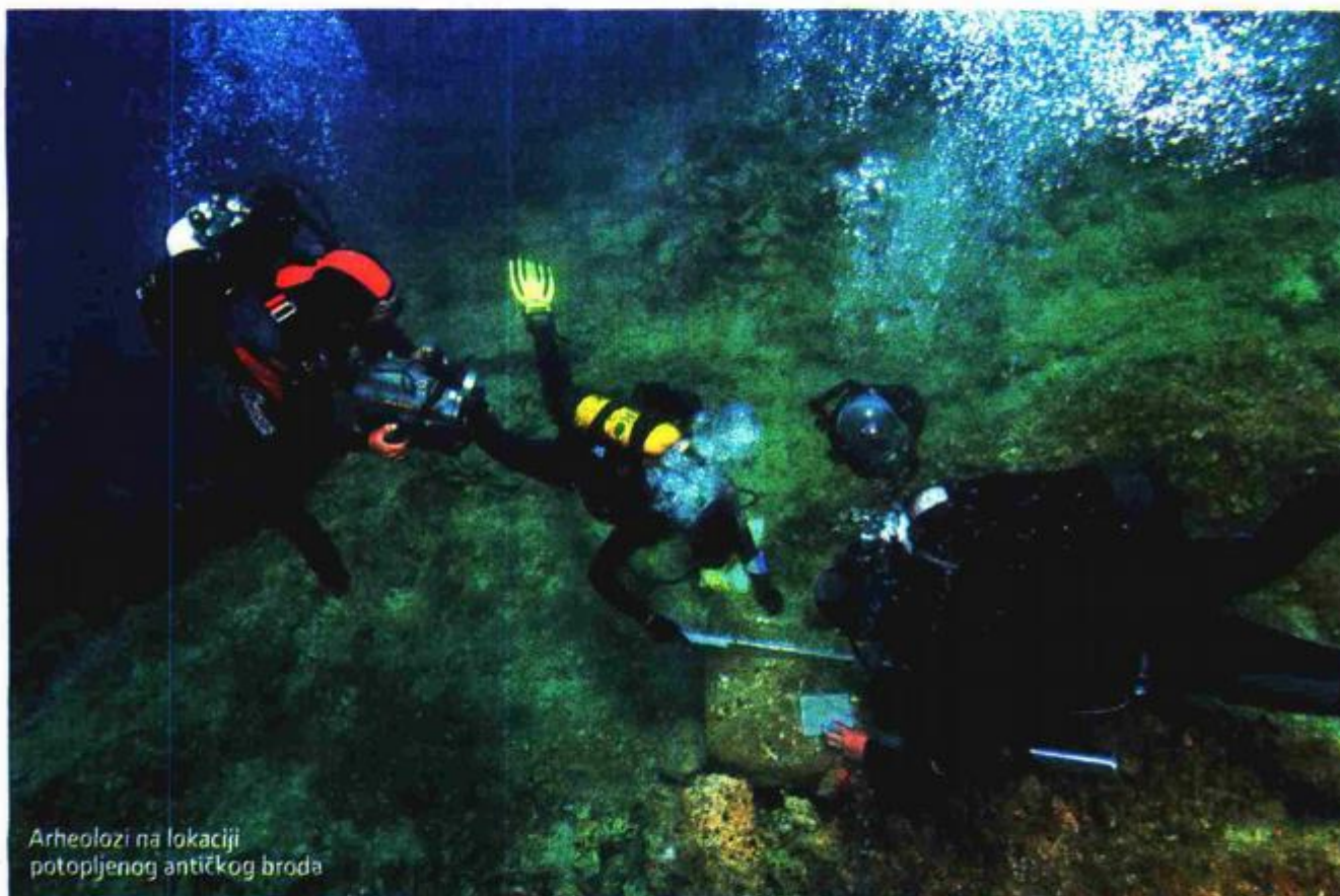
Arheolozi na lokaciji potopljenog antičkog broda

- Prema pronađenom materijalu zaključujemo kako bi polazna luka broda kojeg